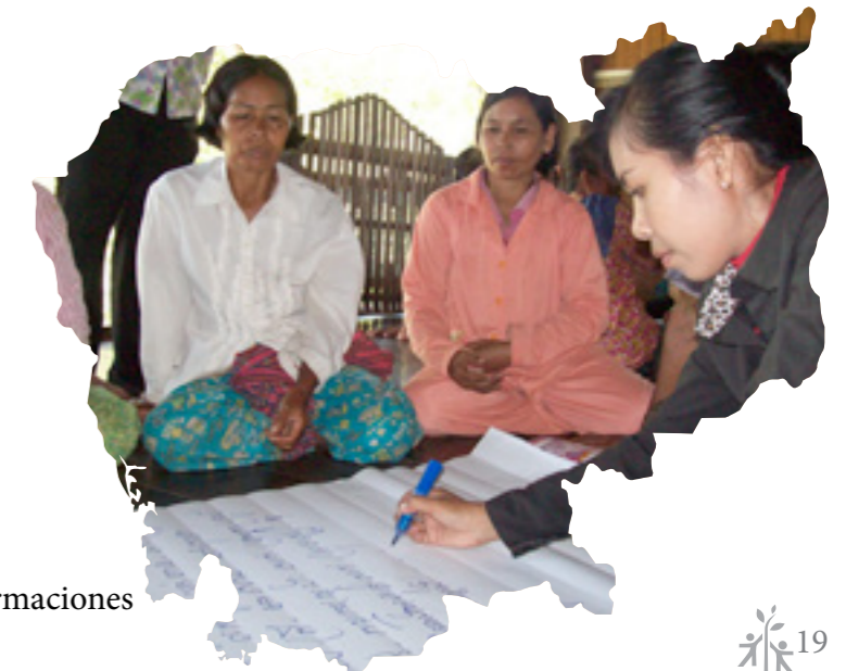
Las mujeres también participan en las formaciones comunitarias en acuicultura (Camboya)

En el entorno rural camboyano la mujer sufre una desigualdad. En el caso de la acuicultura a pesar de participar en todas las fases del proceso, se encuentra invisibilizada y no se valora su papel ni su trabajo. Este proyecto trabaja directamente con la Administración local de Pesca para implementar una estrategia de integración de hombres y mujeres, identificando áreas potenciales para la acuicultura, creando nexos entre productores, distribuidores y vendedores y asegurando la participación de la mujer en todo el proceso. Se apoya técnicamente a 400 granjas de engorde y a 8 de producción de alevines para mejorar la calidad higiénico-sanitaria del pescado; además, se busca incrementar la producción anual de las explotaciones y optimizar las relaciones comerciales a través de la creación de redes de productores acuícolas.