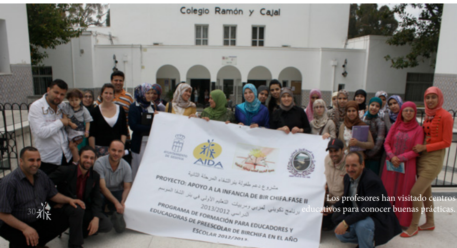
Los profesores han visitado centros educativos para conocer buenas prácticas.

Partiendo de las necesidades detectadas en la primera fase del proyecto, esta intervención –que comenzó en los últimos meses de 2012-, se dirige a apoyar a la infancia del barrio de Birchifae (Tánger). Para ello se ha trabajado, por una parte, con dos asociaciones del barrio posibilitando que mejoren sus infraestructuras y capacidades para ofrecer educación preescolar, refuerzo educativo, evitar el abandono escolar y desarrollar un programa de sensibilización para las familias. Una segunda parte del proyecto se desarrollará con los maestros de las “hadanas” (pequeñas guarderías informales con pocos recursos), con el objetivo de mejorar la calidad de la educación que ofrecen. De esta manera, una vez que termine la intervención el impacto perdurará.