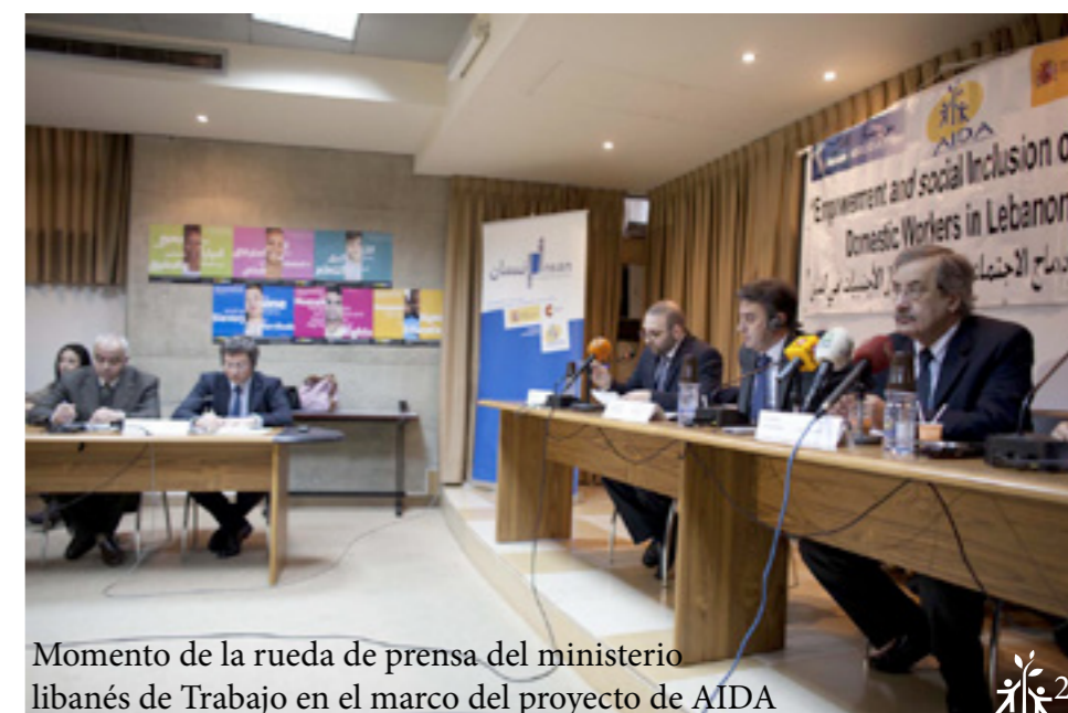
Momento de la rueda de prensa del ministerio libanés de Trabajo en el marco del proyecto de AIDA