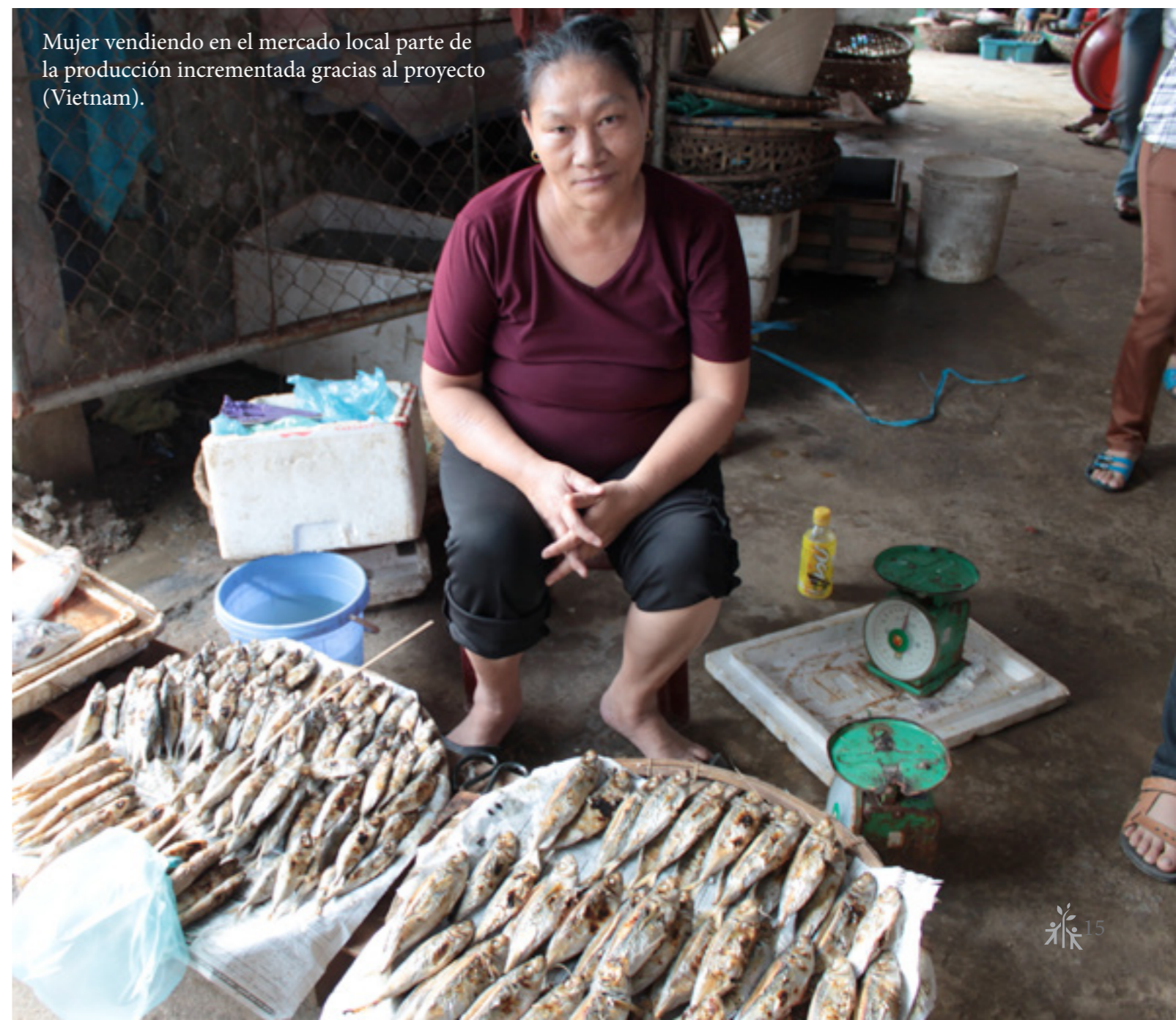
Mujer vendiendo en el mercado local parte de la producción incrementada gracias al proyecto (Vietnam).

La construcción del embalse de Hua Na obligó a más de 4.000 personas, en su mayoría de la etnia Thai, a dejar sus hogares. AIDA, junto con el Ministerio de Agricultura y Desarrollo Rural vietnamita, ha trabajado con 155 familias, ayudándoles a integrar en los embalses una producción sostenible de pescado en jaulas para consumo familiar y venta en los mercados locales. Además, se ha trabajado para hacer más visible el impacto positivo, tanto desde el punto de vista socioeconómico como ambiental, de la actividad acuícola desarrollada por comunidades indígenas.