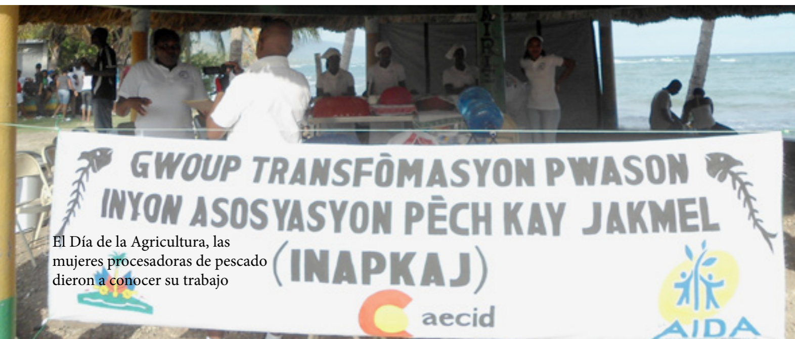
El Día de la Agricultura, las mujeres procesadoras de pescado dieron a conocer su trabajo

Este proyecto, orientado al desarrollo de la acuicultura en Haití como forma de aumentar la seguridad alimentaria y en respuesta a una petición expresa de las autoridades del país, ha comenzado a finales de este año. Se centra en fortalecer institucionalmente a la dirección de Pesca y Acuicultura, formar a los técnicos, y mejorar las herramientas de gestión en tres departamentos (Oeste, Centro y Sureste) del país. Los beneficiarios finales de la intervención son los acuicultores de los tres departamentos objetivo, e indirectamente la población de la zona que dispondrá de mejor alimentación, incorporando un mayor aporte proteínico a su dieta.