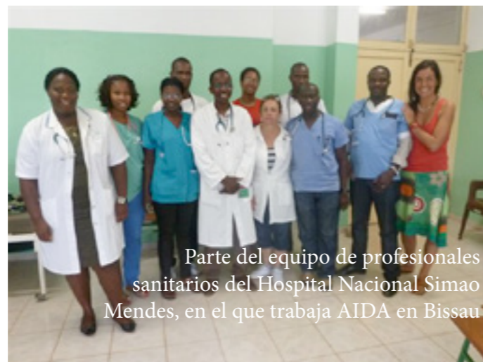
Parte del equipo de profesionales sanitarios del Hospital Nacional Simao Mendes, en el que trabaja AIDA en Bissau

Como complemento al trabajo de AIDA en el Hospital Nacional Simao Mendes de los últimos años, esta intervención tiene como objetivo mejorar la asistencia clínica en el servicio de pediatría del Hospital. Para ello se ha trabajado, por una parte, para reforzar las capacidades de los recursos humanos de este servicio, y por otra para dar apoyo y orientación al propio director de servicio posibilitando una optimización del funcionamiento del mismo. Además, este proyecto ha servido para reforzar el equipamiento básico del servicio, permitiendo una mejor en el funcionamiento de la Unidad de Recuperación de Niños Desnutridos, Urgencias Pediátricas y Recuperación de Quemados y Consultas Externas.