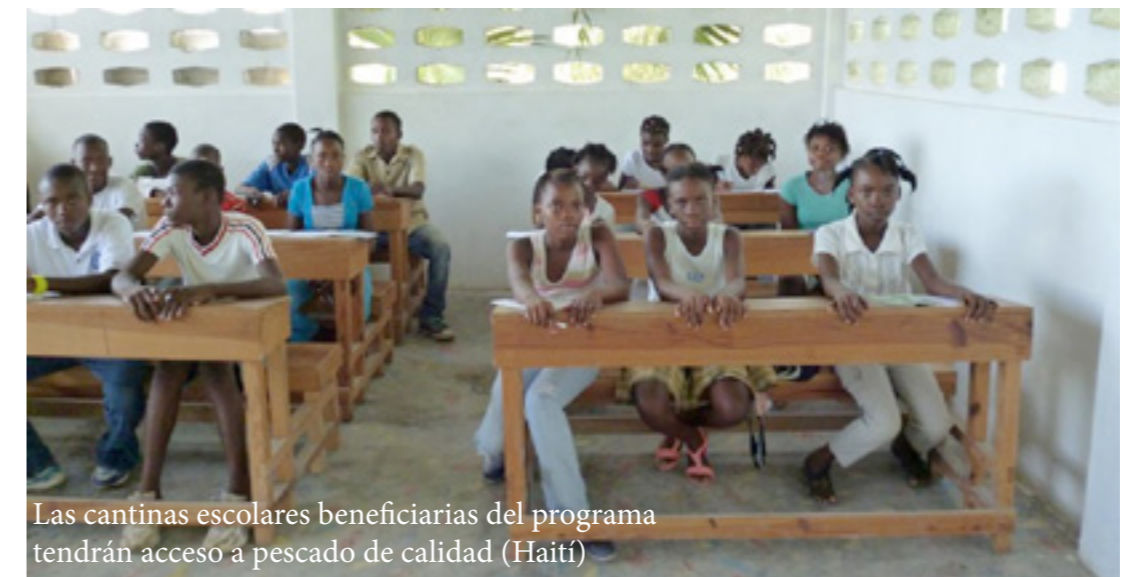
Las cantinas escolares beneficiarias del programa tendrán acceso a pescado de calidad (Haití)