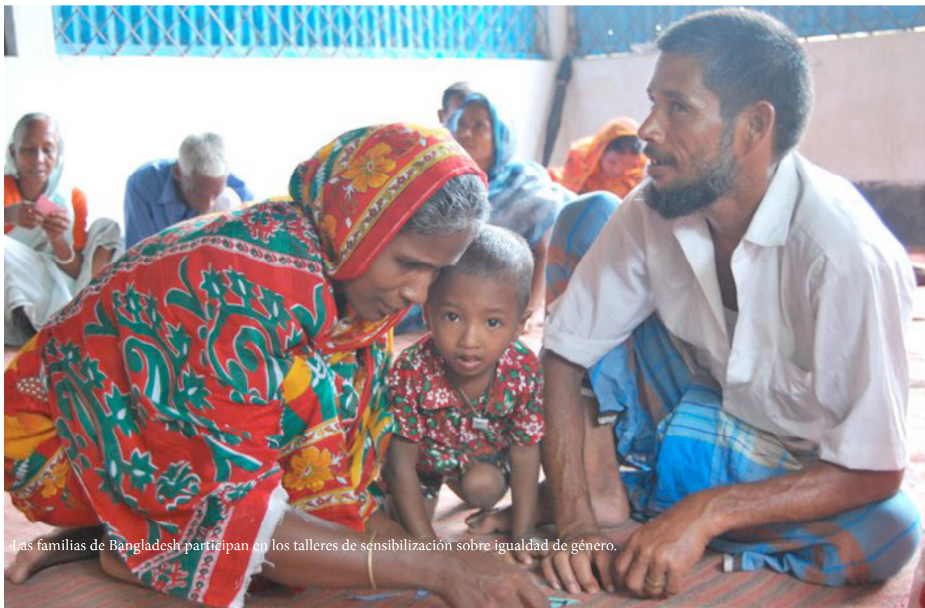
Las familias de Bangladesh participan en los talleres de sensibilización sobre igualdad de género.

Sostenibilidad: en el sentido de permanencia de los resultados conseguidos con la ejecución de nuestros proyectos y en sus tres versiones: social, económica y ambiental.