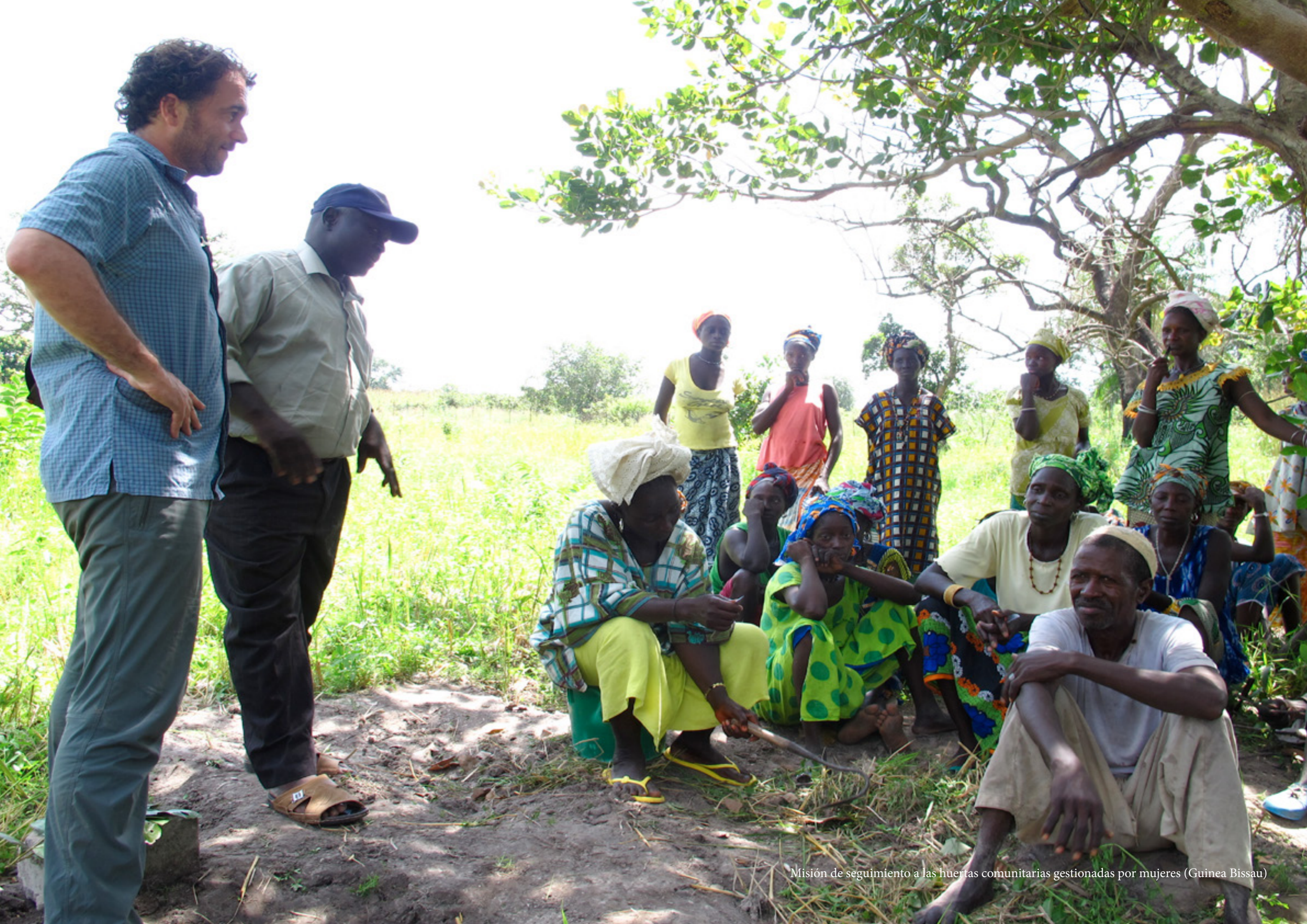
Misión de seguimiento a las huertas comunitarias gestionadas por mujeres (Guinea Bissau)