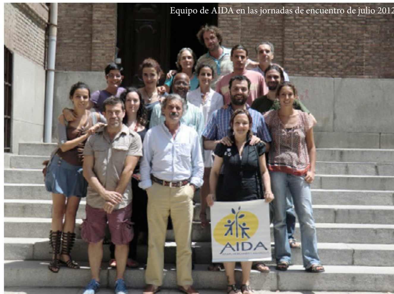
Equipo de AIDA en las jornadas de encuentro de julio 2012