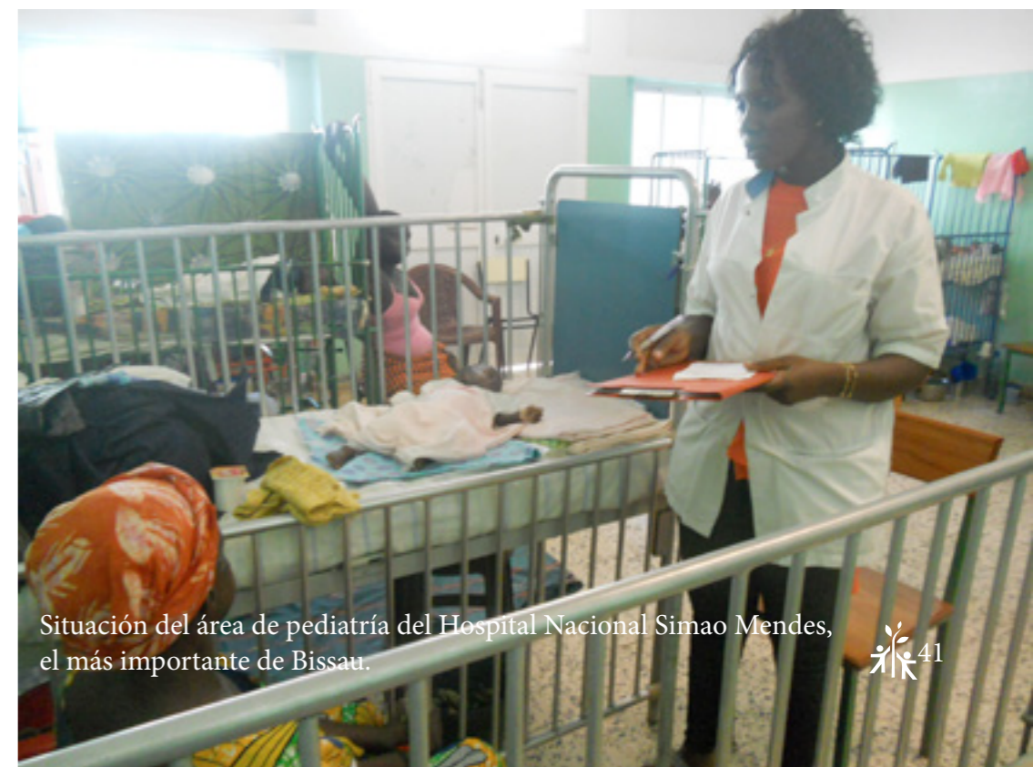
Situación del área de pediatría del Hospital Nacional Simao Mendes, el más importante de Bissau.

Consolidando la intervención realizada por AIDA desde febrero de 2008 en el marco del Protocolo de colaboración establecido por el Ministerio de Salud y la Asociación Céu e Terras, el proyecto se encarga de dar asistencia integral a los enfermos seropositivos y reducir la tasa de transmisión vertical de VIH en Bissau. Para ello se realizan gratuitamente tests de determinación de VIH, acompañados de asesoramiento a pacientes y familiares en situación de riesgo, entrega de fármacos para el tratamiento de SIDA y profilaxis de enfermedades asociadas al estado de inmunodepresión. También se ofrece apoyo nutricional a hijos de mujeres seropositivas, y tratamiento y seguimiento médico y psicológico personalizado.