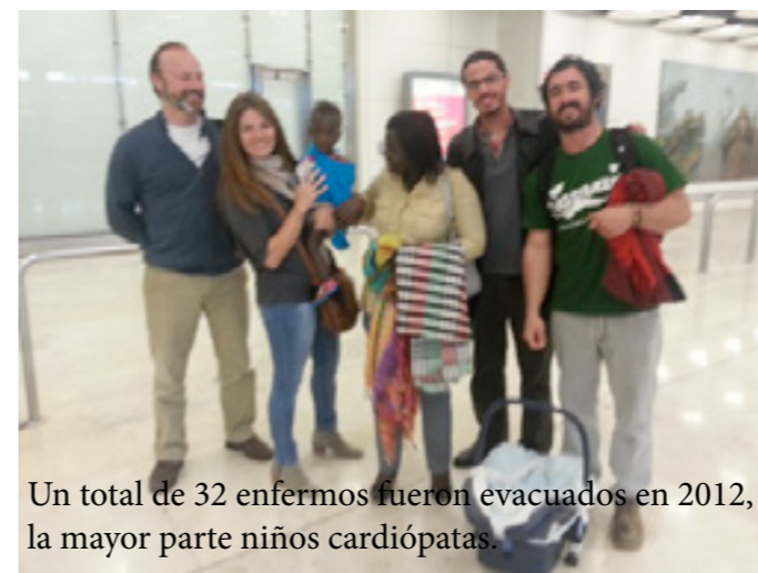
Un total de 32 enfermos fueron evacuados en 2012, la mayor parte niños cardiopatas.

Durante la ejecución del proyecto se ha facilitado la evacuación de 32 enfermos muy graves, la mayoría de los cuales han sido tratados con éxito en diferentes hospitales de Portugal, España, Italia y Suiza. El grueso del proyecto está enmarcado en un tratado bilateral de salud entre los gobiernos de Portugal y Guinea Bissau por el cual la sanidad pública portuguesa se compromete a tratar a niños que no pueden ser operados con éxito en Guinea. La labor de AIDA es identificar los casos clínicos más graves y darles asistencia médica antes de su evacuación, realizar una evaluación socioeconómica de las familias para ayudar a aquellos que más lo necesitan, apoyarles en la obtención del visado médico para poder viajar y financiar los viajes; los socios de Europa, por otro lado, se ocupan de encontrar el equipo médico y el hospital en el que operar a los niños, dan asistencia social a los niños una vez que llegan al país de destino y hacen un seguimiento de los casos asegurando la cobertura médica de forma gratuita a su vuelta al país de origen.