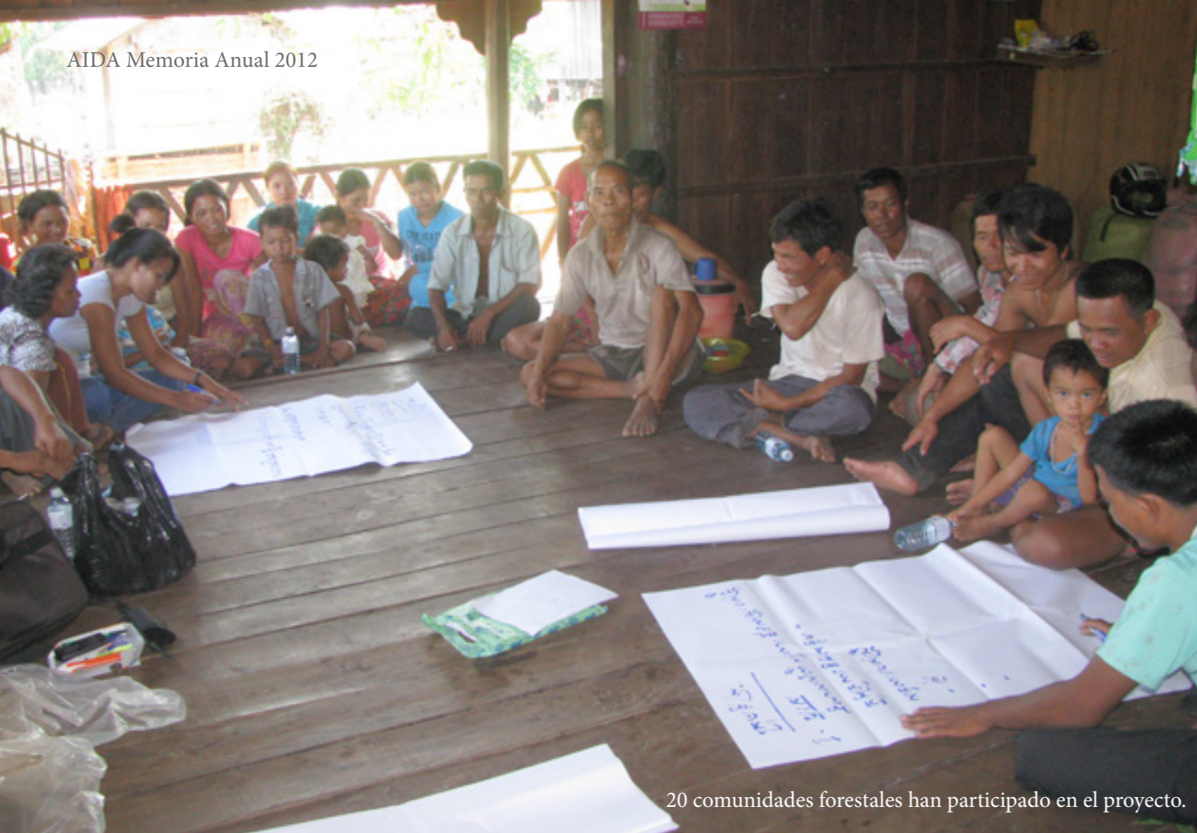
20 comunidades forestales han participado en el proyecto.