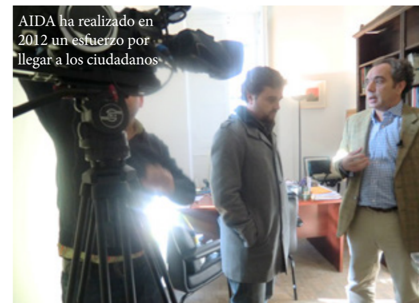
AIDA ha realizado en 2012 un esfuerzo por llegar a los ciudadanos

Universidad Juan Carlos I CAPA International Education Instituto Ortega y Gasset Universidad de Granada Universidad de Salamanca Universidad de Educación a Distancia Universidad Carlos III Universidad de Valladolid Universidad de Pavia Universidad de Sevilla Universidad Complutense Universidad de Grenoble Universidad de Brest Universidad Autónoma de Barcelona Instituto Europeo de Diseño Universidad a Distancia de Madrid