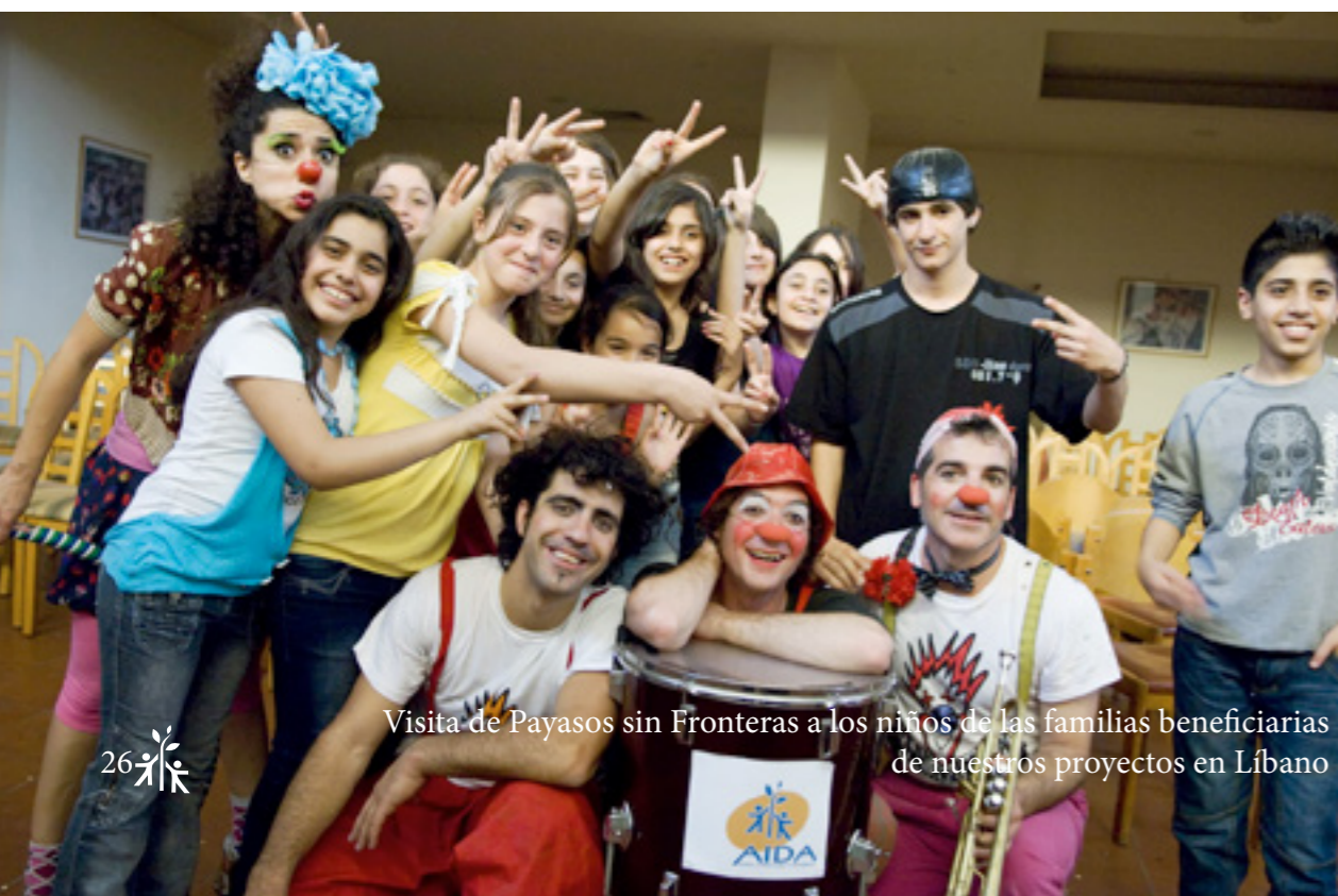
Visita de Payasos sin Fronteras a los niños de las familias beneficiarias de nuestros proyectos en Líbano

Las trabajadoras domésticas inmigrantes son un colectivo doblemente vulnerable, por su situación de marginalidad y por su invisibilidad. La ley laboral libanesa les excluye expresamente lo que fomenta su explotación. Abundan los casos de confiscación del pasaporte, maltratos, abusos, retención de salario, horarios excesivos y ausencia de vacaciones. Sus hijos no pueden ser registrados, por lo que se ven privados de educación y condenados a la marginalidad. A través del proyecto se presta asistencia social y representación legal a las trabajadoras, por un lado. Por otro, se sostiene un centro educativo propio que prepara a los hijos de estas mujeres para integrarles posteriormente en el sistema educativo nacional. Finalmente, el proyecto sensibiliza a la sociedad libanesa sobre la situación de estas mujeres y sus hijos.