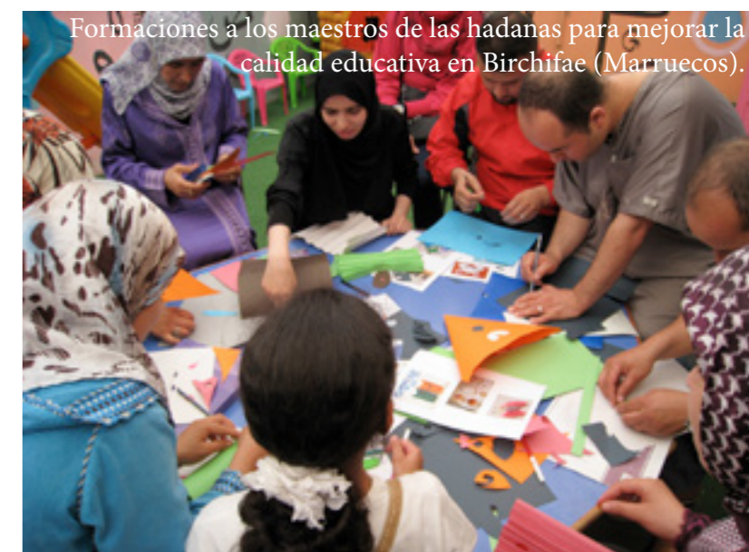
Formaciones a los maestros de las hadanas para mejorar la calidad educativa en Birchifae (Marruecos).