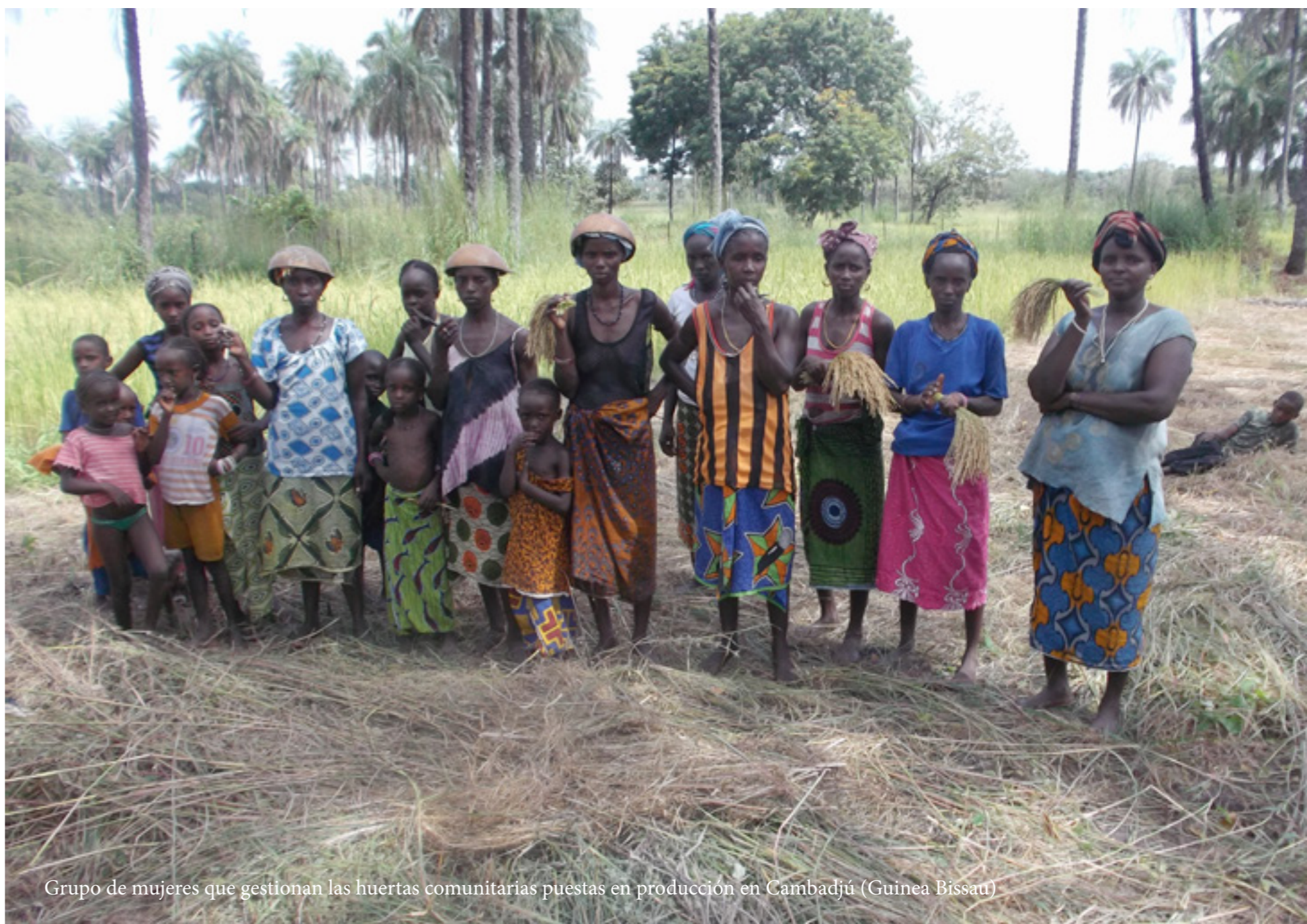
Grupo de mujeres que gestionan las huertas comunitarias puestas en producción en Cambadjú (Guinea Bissau)