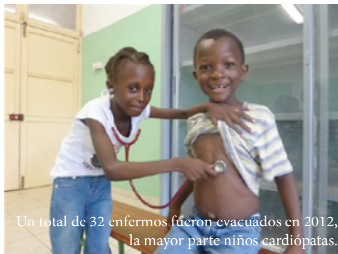
Un total de 32 enfermos fueron evacuados en 2012, la mayor parte niños cardiopatas.

Guinea Bissau es uno de los países más pobres del mundo, ocupa el puesto 176 (de 187 países) según su IDH 2011. La esperanza de vida media no supera los 50 años, uno de cada dos adultos es analfabeto, a tasa de adultos analfabetos es de un 57.8% y dos de cada tres personas viven por debajo del umbral de la pobreza. En este escenario AIDA trabaja, desde 2006, en el sector salud y educación; además, busca alternativas de generación de ingresos a través de la pesca y la agricultura.