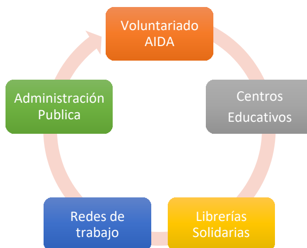
Actores clave en las intervenciones de AIDA en ED

La organización tiene como objetivo aumentar su presencia en las CC. AA. Esto se alcanzará a través del fortalecimiento de su base social, con la puesta en marcha de actividades tanto en educación formal, no formal e informal. Los principales actores sociales involucrados serán las librerías solidarias, a través de su voluntariado, las administraciones públicas, las redes de trabajo existentes (como los grupos de trabajo de las coordinadoras de ONGD) y los centros escolares.